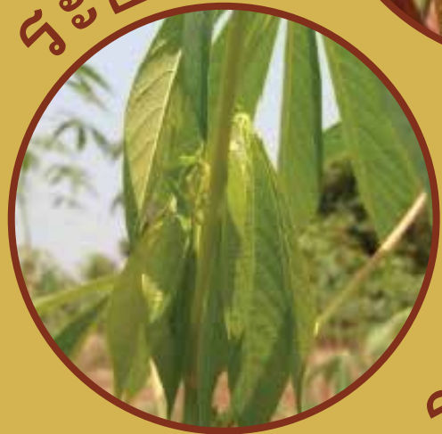
ระยะปลูก 11